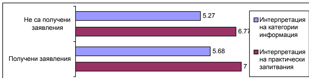
Графика 3: Практики по интерпретация

Емоционално-предметните типове възприятия и категоризация на запитванията са твърде естествени и човешки. Не бихме могли да очакваме, че служителите мислят само в нормите на ЗДОИ. В същото време обаче начините, по които служителите категоризират запитванията говорят за недобро познаване на закона. Всъщност, в много от посетените институции служителите споделят, че