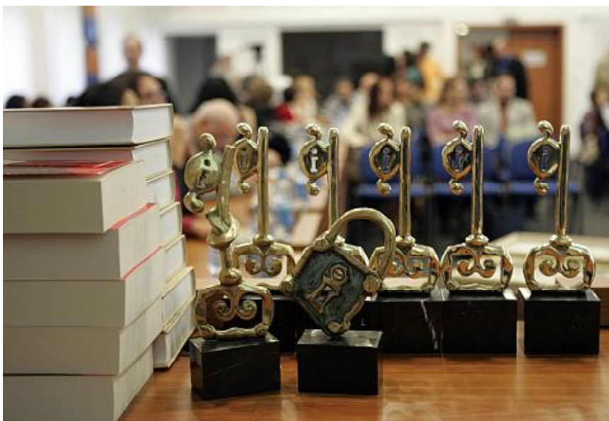
Наградите, раздадени на церемонията по случай международния ден на правото да знам през 2006 г.

и Южна Африка, а също така и представители на международни организации, работещи в тази област. На 28 септември 2002 г. бе учредена и Международната мрежа на застъпниците за свобода на информацията (Freedom of Information Advocates