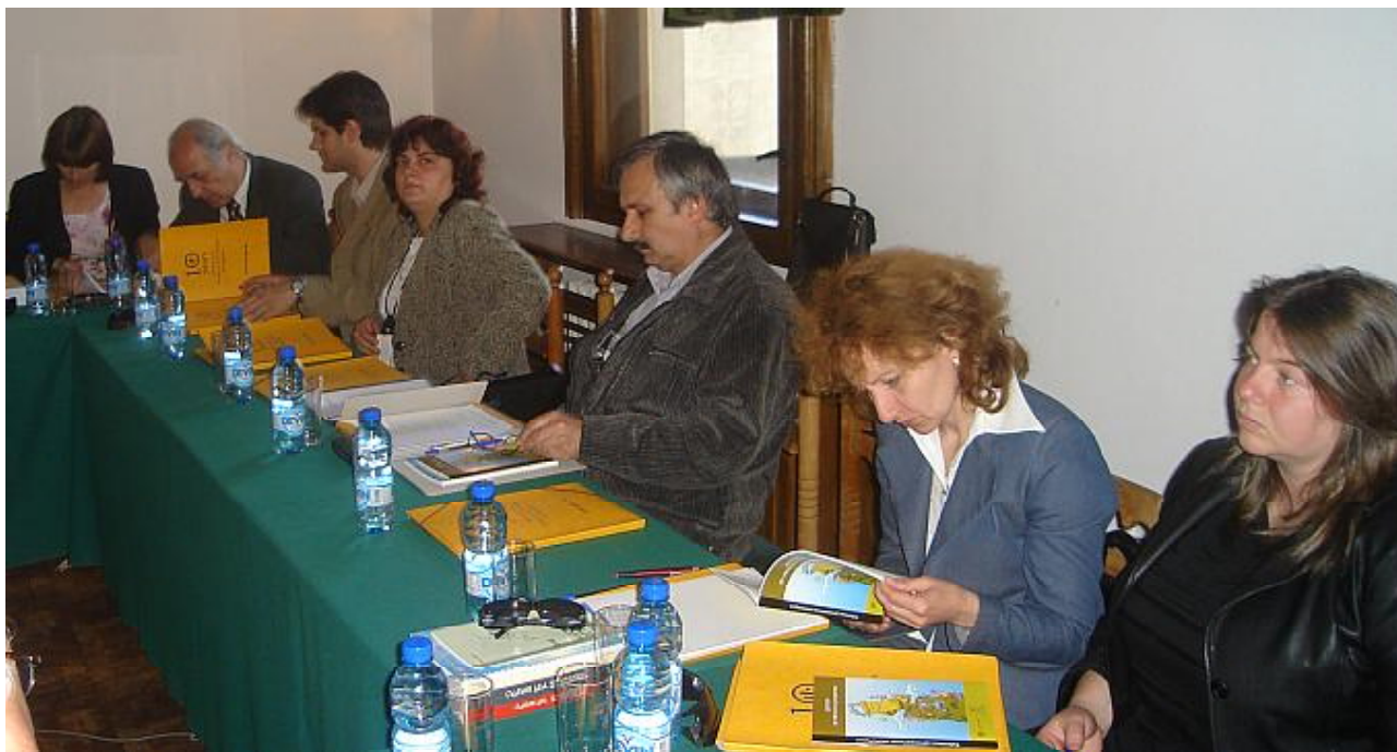
Срещата във Велико Търново събра близо 30 експерти по информационно и административно обслужване на граждани, секретари на общини, служители за връзки с обществеността и журналисти от областите Велико Търново, Габрово, Ловеч и Плевен

Проектът „Увеличаване прозрачността и отчетността на управлението чрез електронен достъп до информация“ се изпълнява с подкрепата на Доверителния фонд на Програма за развитие на ООН - България. Предстоят подобни срещи в Разград, Бургас, Варна и Пловдив.