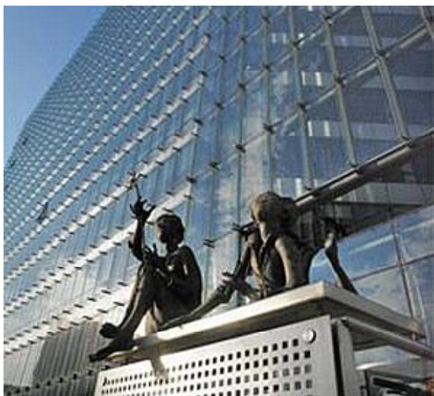
Сградата на Европейската комисия в Брюксел

За нас ще бъде полезно да припомним накратко историята на сегашните дебати. През последните петнадесет години принципът на откритост беше признат за основен демократичен принцип в Европейския съюз. Началото беше поставено в Договора от Маастрихт. За да приложат принципа, Съветът и Комисията приеха Кодекс на поведение [Code of Conduct] за достъп до техните документи като изпълнение на информационната и комуникационната им политика. След договора от Амстердам и приемането на Регламент №1049/2001 г., правото на гражданите на ЕС и юридическите лица, със седалища в страните-членки, да имат достъп до документите на Европейския парламент, Съвета и Комисията стана част от общностното право. Регламентът влиза в сила от 3 декември 2001 г. и институциите започват да публикуват годишни