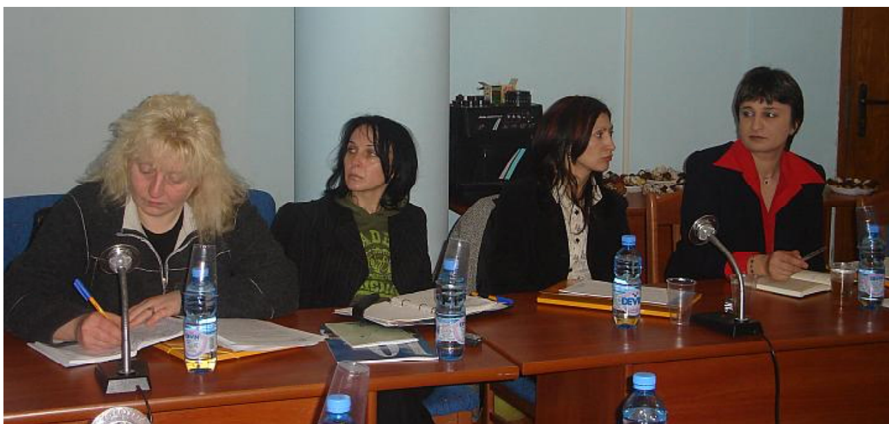
Срещата в Монтана събра близо 30 експерти по информационно и административно обслужване на граждани, секретари на общини, служители за връзки с обществеността и журналисти от областите Враца, Монтана и Видин