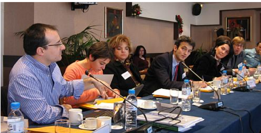
Участници в конференцията

Три години делят застъпниците за свобода на информацията от основаването на Мрежата. „Много неща се случиха през тези три